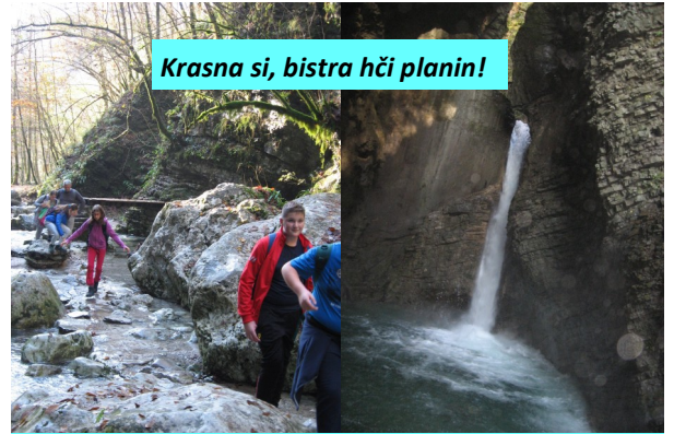
Krasna si, bistra hči planin!