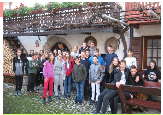
V Vrhnem pred Gregorčičevo rojstno hišo .

Učenci tretje triade so pred tem obiskali Posočje. Ogledali so si kobariški muzej, se seznanili s potekom najhujših bitk soške fronte, pokukali v rojstno hišo Simona Gregorčiča, goriškega slavčka, ter si ogledali čudoviti slap Kozjak.