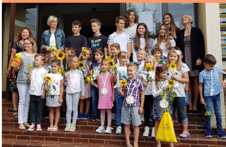
Prvošolci z devetošolci, ravnateljico in učiteljicami.